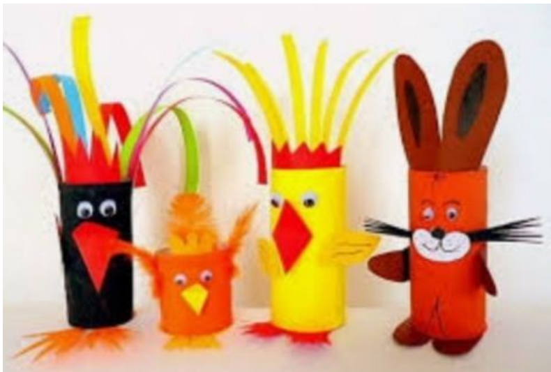
aus Papierrollen gebastelt